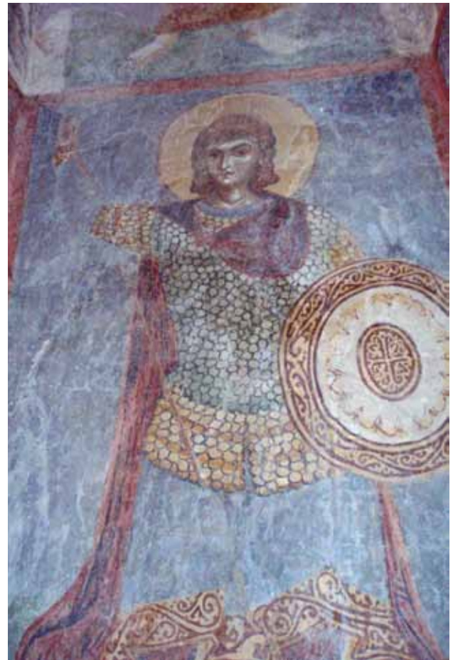
10. Св. Орест, црква Св. Пантелејмон - с. Нерези.

е облечена во клибанион од ламеларен тип. Ламелите, како што е вообичаено, се свртени со врвот нагоре, со јасно видливи три перфорации. Меѓу нив постои кожен „граничник“, кој ја спречува тежината на плочките да падне врз кожените жилки што ги поврзуваат. 7 Двете бои на ламеларните