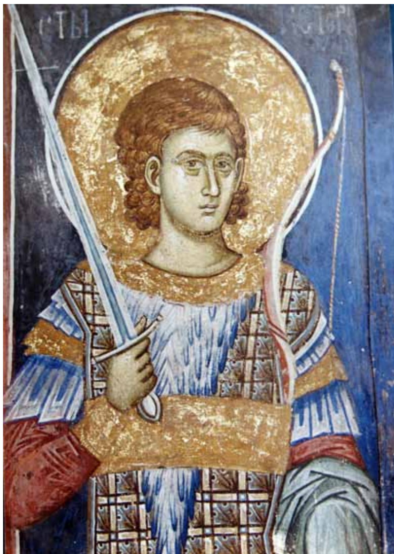
20. Св. Нестор, Манастир Дечани, Косово.

Сепак, во XIII век кај нас се јавуваат и првите обиди за претставување на синцирестиот панцир. Во црквата св. Никола во Варош кај Прилеп (1298) 22 , еден од чуварите на Христовиот гроб е облечен во панцир што се разликува од останатите во групата, а во голема мера личи на панцир составен од алки-синцири, кои му го даваат карактеристичниот, мрежест изглед (сл. 13). 23 Кога станува збор за светите војни, повеќето од нив го носат овој панцир како дополнителна заштита на друг панцир или, пак, често е покриен со текстилна ткаенина. Како таков можеме да го наведеме панцирот на св. Теодор Тирон во св. Никола во Варош (сл. 14), а доста реалистични изгледаат и примерите од XIV век - светителот -патрон од Св. Никита кај Скопје (сл. 15) и св. Ѓорѓи од Св. Андреа на Треска (сл. 16).