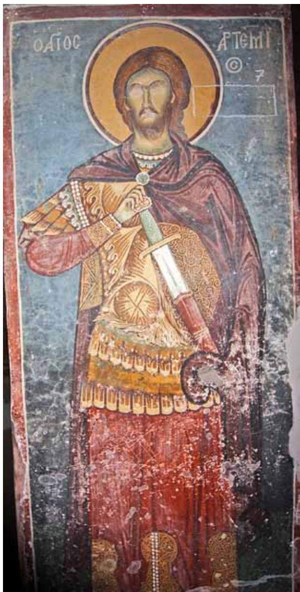
1. Св. Артемиј, црква Св. Никола - с. Манастир, Мариово