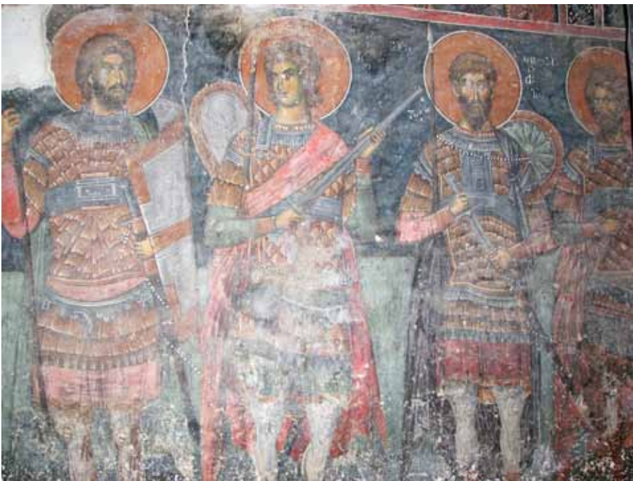
19. Св. Артемиј, св. Прокопиј, св. Тедор Тирон, св. Тедор Стратилат, црква св. Никола во Псача.

не би требало да ги врземе само со крстоносците. Од наведените примери фрески на кои е препознаен овој панцир, очигледно е дека станува збор за панцири составени од сосема мали кружни метални парчиња-фолиди, кои често се прикажани како се преклопуваат едни преку други, што индицира дека веројатно станува збор за вид на крушестите панцири, а не за синцирести, како што се претпоставува. Во црквата во Нерези, во ваков панцир се облечени св. Нестор (сл. 2), св. Теодор Тирон (сл.3) и св. Орест (сл. 10), св. Ѓорѓи од истоимената црква во Курбиново (сл. 8), 21 и истиот светител од св. Врачи во Костур (сл. 11), додека