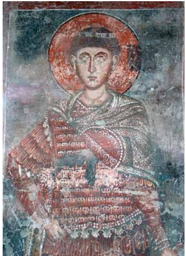
6. Св. Димитрија, црква Св. Димитрија, Варош - Прилеп