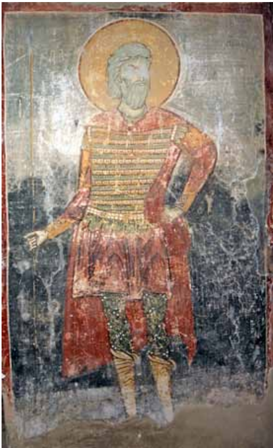
5. Св. Андреја Стратилат, црква Св. Никола - с. Манастир, Мариово