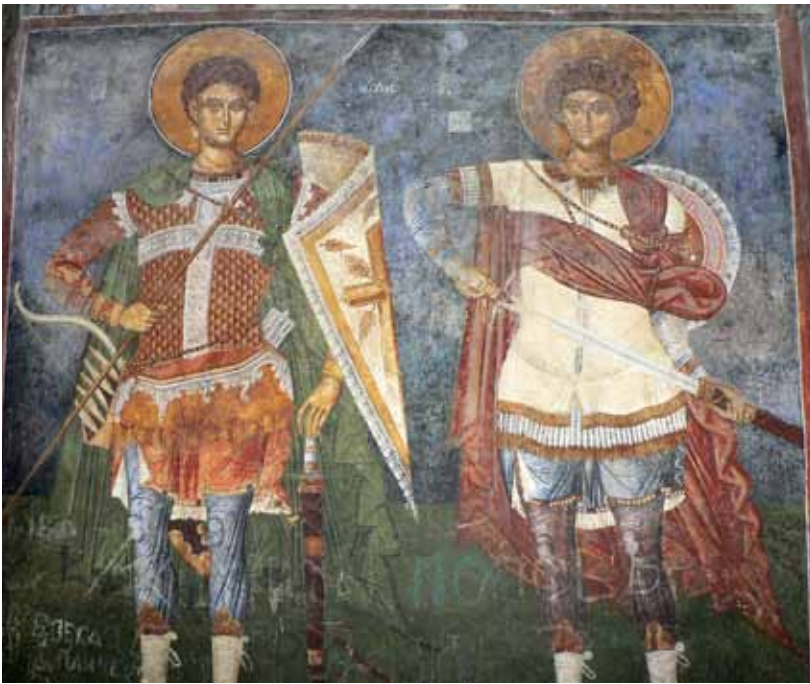
16. Св. Димитрија, св. Ѓорѓи, црква Св. Андреја на Треска, с. Матка - Скопје