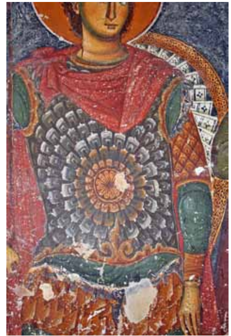
17. Св. Прокопиј, црква Св. Никола, Варош - Прилеп.

пак, од своја страна, условува поголем број перфорации кај ламеларните) и изгледот ( најчесто „U“ форма на крлушестите и правоаголна, со најчесто заоблени краеве свртени нагоре кај ламеларните). Меѓутоа, кога се работи за користење на ликовните извори при реконструкција на панцирите, овие разлики се занемарливи и тешки за уочување. Често се случува еден панцир (на пр. оној на св. Димитрија од Св. Врачи во Костур) од различни автори, да биде препознаен како типичен претставник како на крлушестите, така и на ламеларните панцири. 16 Навидум добар пример за крлушест панцир наоѓаме кај св. Прокопиј од Манастир, Мариово (1271), каде што плочките се со „U“ форма, со две перфорации (сл. 9) 17 . Сепак, панцирот го нема карактеристичниот изглед на рибји крлушки, затоа што меѓу плочките, хоризонтално и вертикално постојат граници, со иста боја како и подлогата, поради што плочките не се преклопуваат меѓу себе.