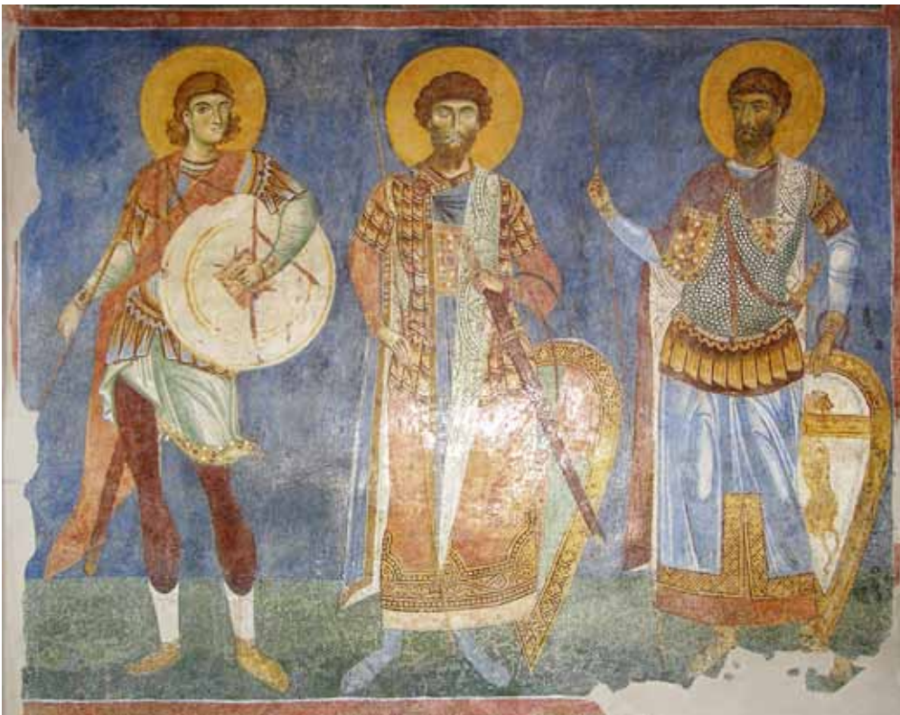
3. Св. Прокопиј, св. Теодор Стратилат, св. Теодор Тирон, црква Св. Пантелејмон - с. Нерези

византискиот klibanion , најупотребуваниот и најчесто претставуваниот панцир од средновековниот период. 5 Во црквата св. Пантелејмон, Нерези