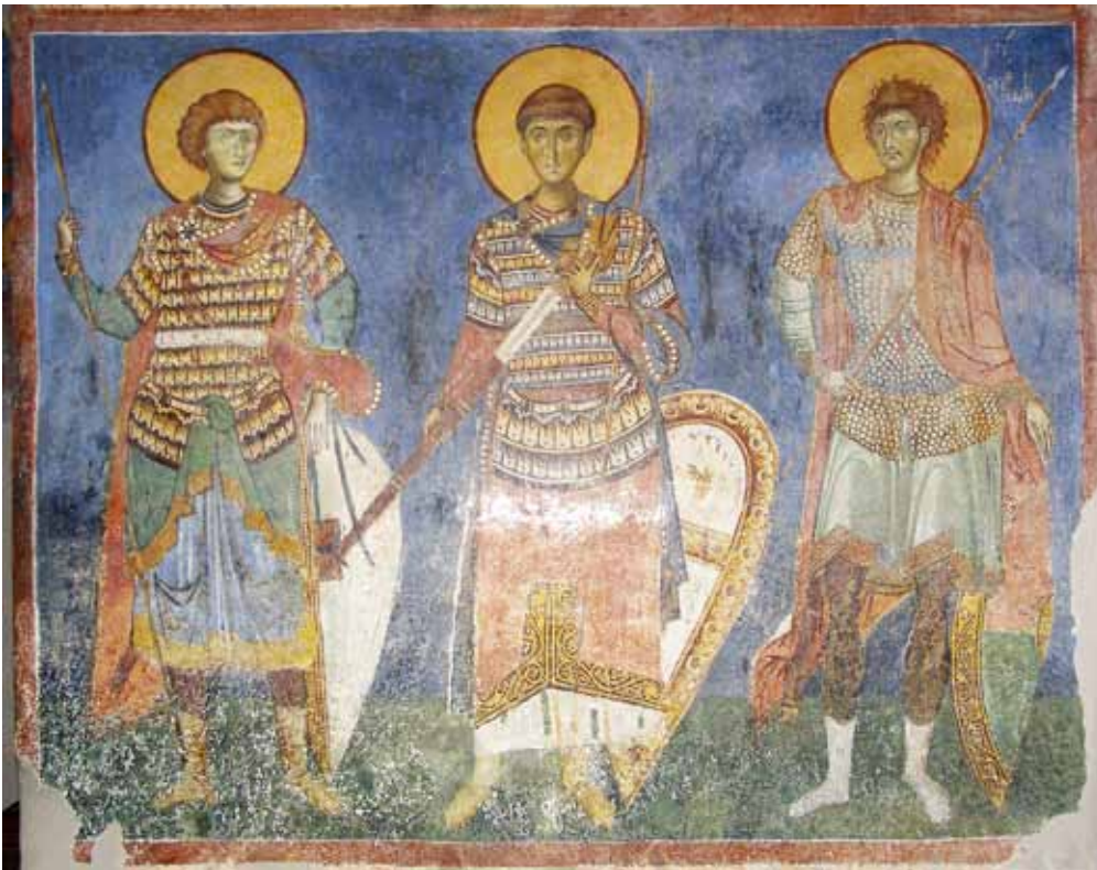
2. Св. Ѓорѓи, св. Димитрија, св. Нестор, црква в. Пантелејмон - с. Нерези