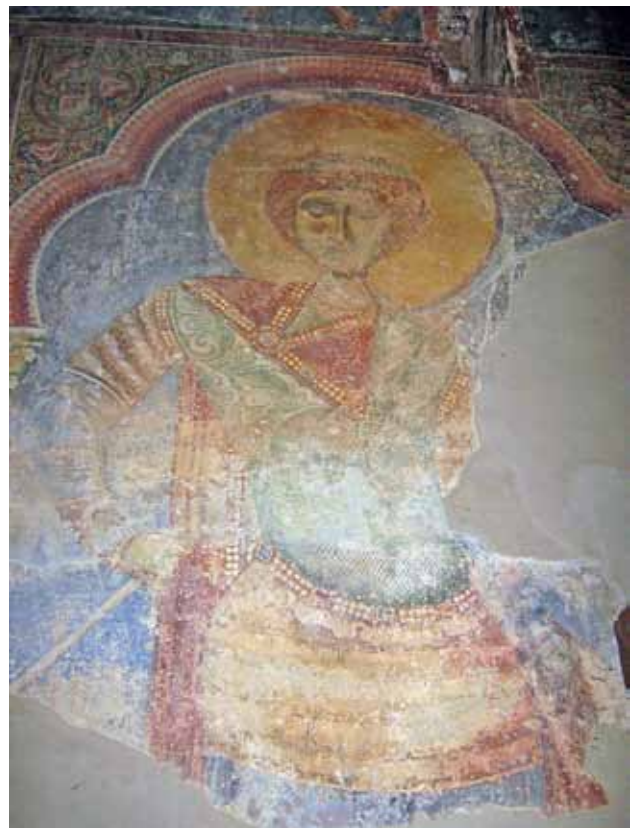
8. Св. Ѓорѓи, црква Св. Ѓорѓи - Курбиново