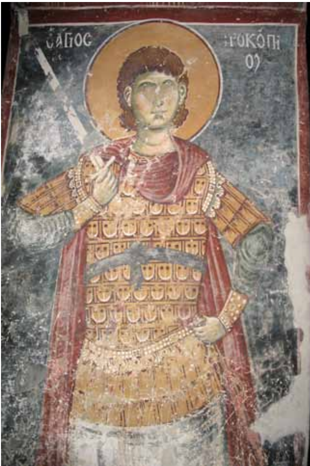
9. Св. Прокопиј, црква Св. Никола - с. Манастир, Мариово