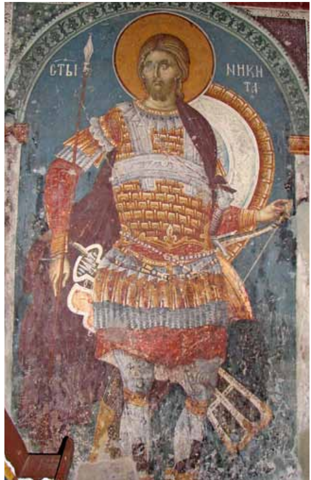
15. Св. Никита, црква Св. Никита - с. Чучер, Скопје

преклопувањето е означено со употреба на различни бои за ламелите (зелена и окер), но ја нема карактеристичната хоризонтална кожена линија меѓу редовите. Таа недостига и кај панцирот на св. Димитрија од истоимената црква во Варош, Прилеп (ок. 1290) 14 , каде што ламелите имаат заоблен врв и граници со нејасна улога од двете страни на ламелата (сл. 6). Сосема редок, но мошне интересен пример, ни дава панцирот прикажан од раката на мајсторите од Курбиново, насликан во нивното прво ремек дело - црквата св. Врачи во Костур (ок. 1180). 15 Фигурата на св.