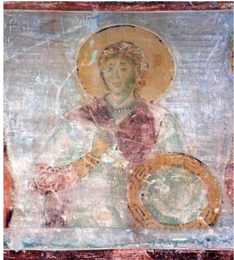
12. Св. Орест, црква Св. Никола - с. Манастир, Мариово

откриени во Големата палата на византиските императори во Истанбул (сл. 21), во археолошкиот контекст од XII век. 10 Веднаш до фигурата на св.Димитрија е насликан и св. Ѓорѓи. Неговиот панцир е составен од плочки, кои имаат четири видливи перфорации и триаголен засечок од долната страна. Немаме блиски аналогии за овој специфичен изглед, но слични парчиња се најдени во војничките гробови од битката кај Висби, од 1346 г. 11 На спротивниот ѕид се насликани фигурите на св. Прокопиј, св. Теодор Стратилат и св. Теодор Тирон (сл. 3). Св. Теодор Стратилат има интересен панцир, составен од плочки, кои се косо засечени во долниот дел. Археолошка потврда за изгледот на ваков панцир имаме од лок. Градина кај Рас, во слојот кој е речиси истовремен со периодот кога се насликани и фреските од Нерези, односно од втората половина на XII век (сл. 21) 12 . Се чини дека овој вид панцир имал долг век на траење - иако стилизиран, и панцирот на св. Теодор Стратилат од Богородица Перивлепта во