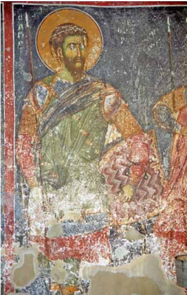
14. Св. Теодор Тирон, црква Св. Никола, Варош - Прилеп.