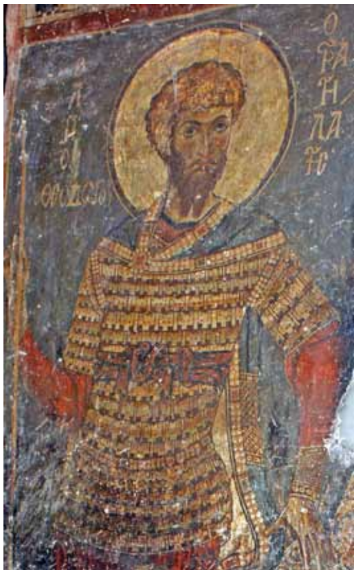
7. Св. Теодор Стратилат, црква Св. Врачи - Костур