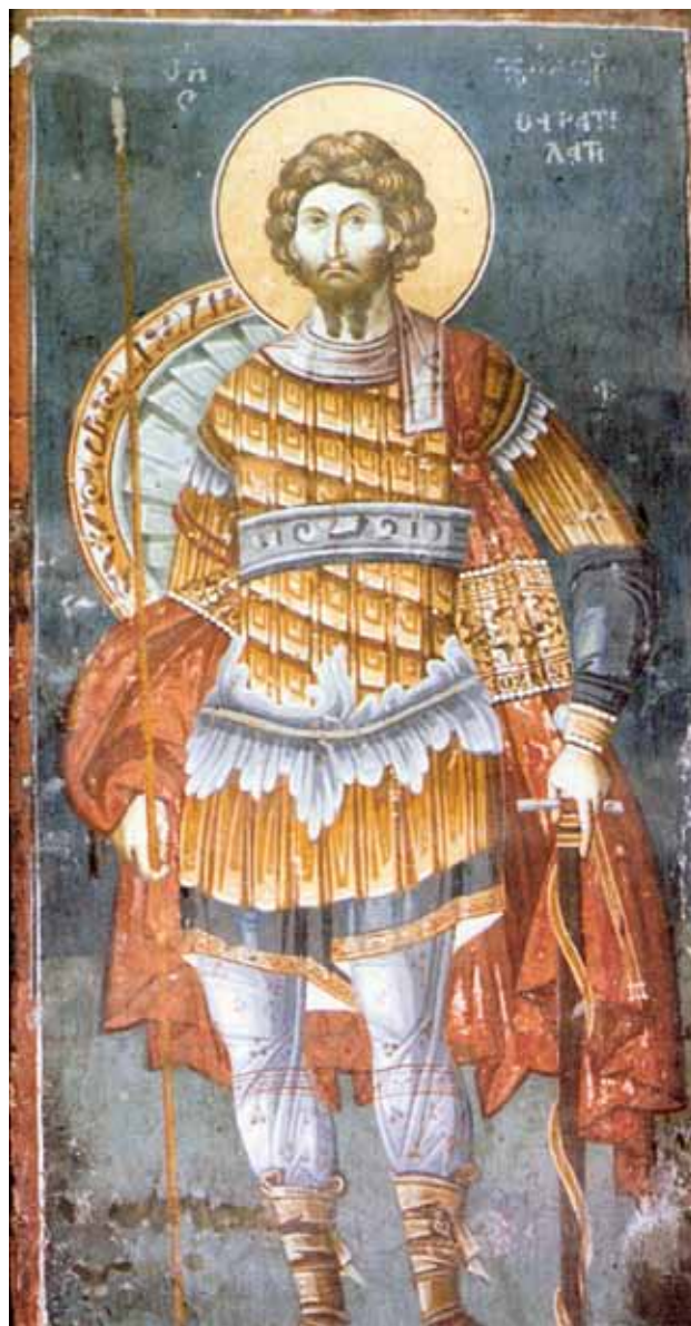
4. Св. Теодор Стратилат, црква Св. Богородица Перивлента, Охрид

веќето автори се согласни дека во периодот на нивното претставување тие веќе не биле во употреба. 3 Долгата историја на ова оружје, како нај-совершенно, но и најтешко изработливо, веројатно завршила кон крајот на VI век. До овој заклучок е дојдено, пред се, поради непостоење на него-во прецизно именување во документите, како и во повторувачкото, шематско претставување во ликовните и скулптуралните монументи. Ако во римскиот период ова оружје било резервирано за „елитните“ слоеви од општеството, како најчест придружник на императорите, во византискиот период тоа е дел речиси исклучиво од облеката на светите војни, додека императорот и другите