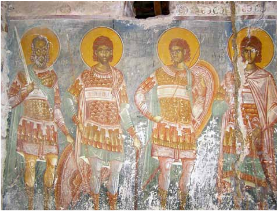
18. Св. Сава Стратилат, св. Евтропиј, св. Клеоник, св. Василиск, црква Успение на Богородица - манастир Трескавец, Прилеп.