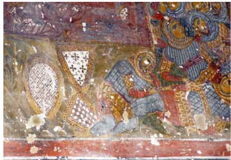
13. Мироносици на гробот (детал), црква Св. Никола, Варош - Прилеп.

откриени во Големата палата на византиските императори во Истанбул (сл. 21), во археолошкиот контекст од XII век. 10 Веднаш до фигурата на св.Димитрија е насликан и св. Ѓорѓи. Неговиот панцир е составен од плочки, кои имаат четири видливи перфорации и триаголен засечок од долната страна. Немаме блиски аналогии за овој специфичен изглед, но слични парчиња се најдени во војничките гробови од битката кај Висби, од 1346 г. 11 На спротивниот ѕид се насликани фигурите на св. Прокопиј, св. Теодор Стратилат и св. Теодор Тирон (сл. 3). Св. Теодор Стратилат има интересен панцир, составен од плочки, кои се косо засечени во долниот дел. Археолошка потврда за изгледот на ваков панцир имаме од лок. Градина кај Рас, во слојот кој е речиси истовремен со периодот кога се насликани и фреските од Нерези, односно од втората половина на XII век (сл. 21) 12 . Се чини дека овој вид панцир имал долг век на траење - иако стилизиран, и панцирот на св. Теодор Стратилат од Богородица Перивлепта во