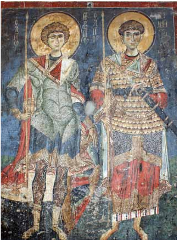
11. Св. Ѓорѓи, св. Димитрија, црква Св. Врачи - Костур